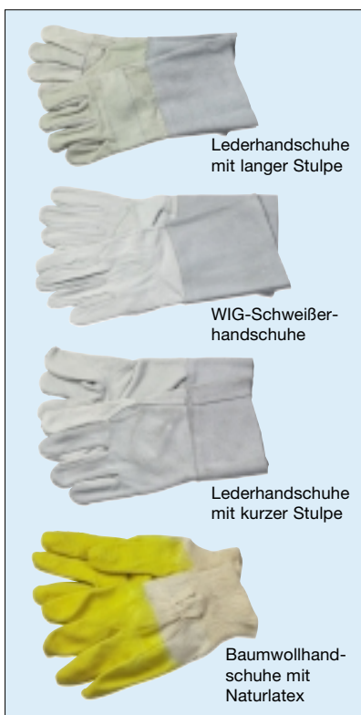
Lederhandschuhe mit langer Stulpe